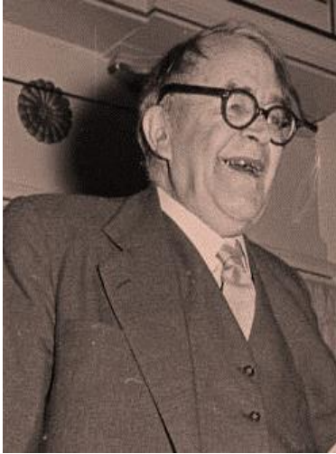
Karl Barth (1886-1968)

Wat zullen de engelen in de hemel toch lachen als ze tot elkaar zeggen: ‘Kijk, daar komt die ouwe Barth met zijn kar vol boeken!’